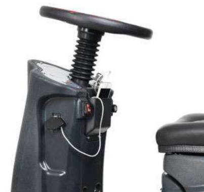
Разъем USB с держателем для телефона