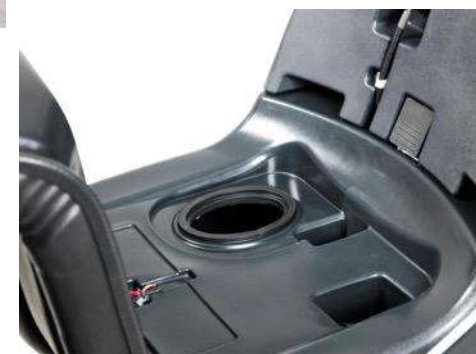
Баки для воды емкостью 120 л