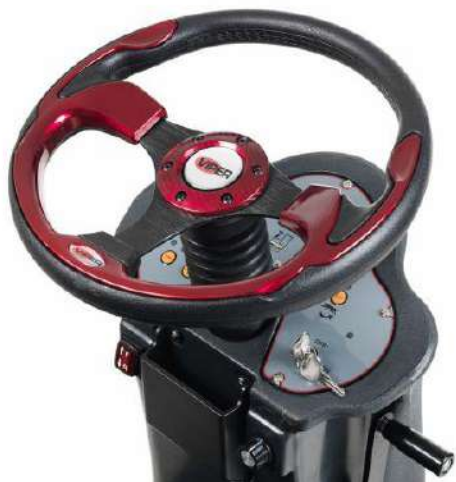
Простое и удобное управление машиной