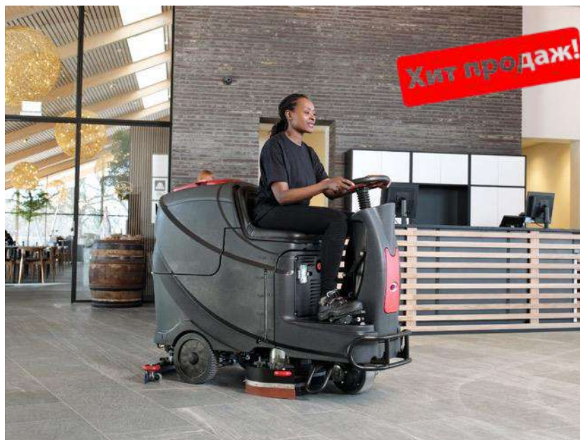
Быстрая и качественная уборка средних и больших площадей